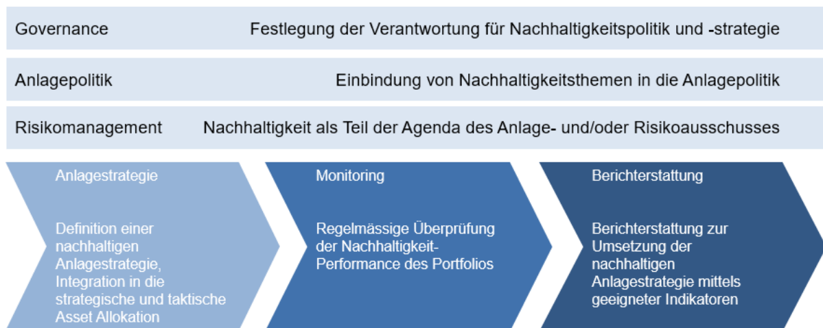
Abbildung 1: Integration von Nachhaltigkeitsaspekten in verschiedene Elemente des Anlageprozesses

Ein nachhaltiger Anlageprozess (in den vorliegenden Empfehlungen bezeichnet dieser Begriff sowohl verantwortungsvolle als auch ESG-konforme Anlagen bzw. Investitionen) umfasst vergleichbare Elemente wie ein üblicher Anlageprozess. Die folgende Grafik bietet einen Überblick über die einzelnen Elemente eines nachhaltigen Anlageprozesses. Die anschliessenden Kapitel entsprechen im Wesentlichen den Punkten der nachfolgenden Graphik: